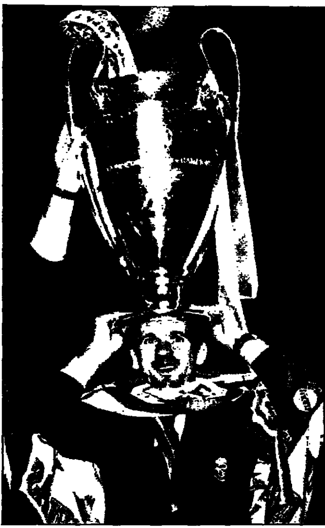
ميدان فيش لاصير ريال مدريد يحمل كأس دوري بون فون الفريق وسط احتفالات ضخمة في مدريد